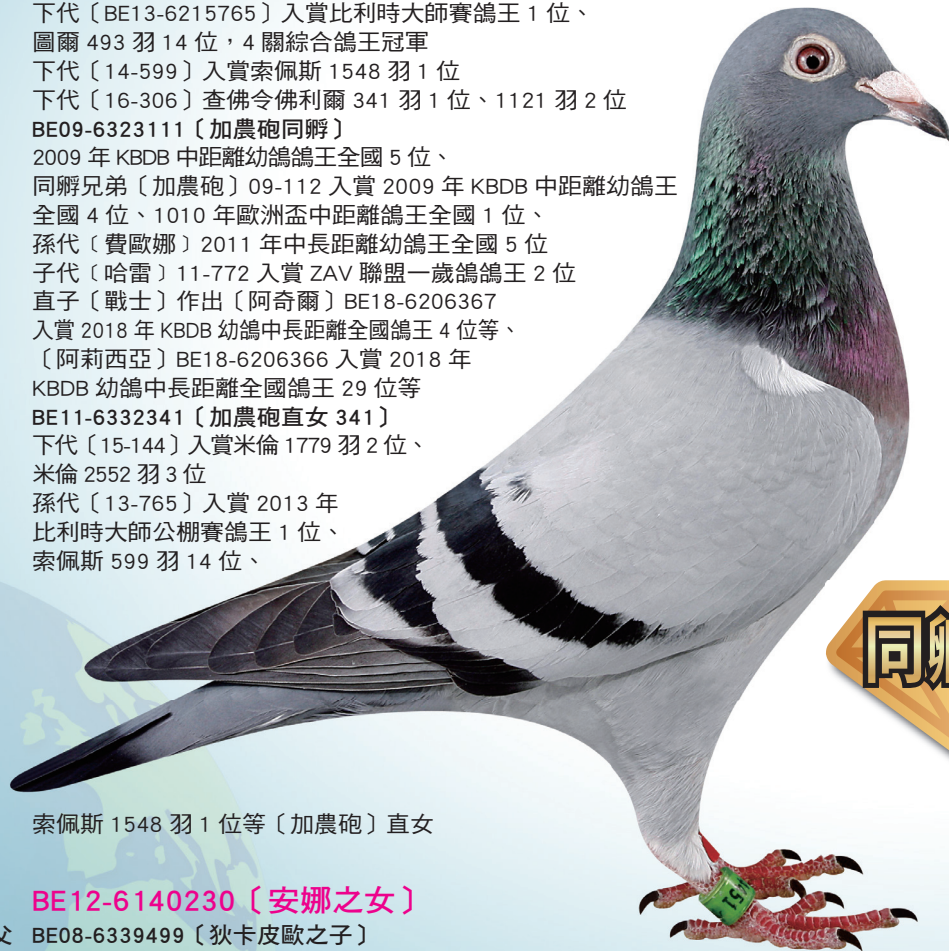
索佩斯 1548 羽 1 位等〔加農砲〕直女